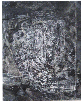
Sabine Hertig · Mirror 2, 2016, Analoge Collage auf Holz, 61 x 50 cm, Galerie Stampa Basel

Auflösung und Verdichtung, Malerei und Fotografie ermöglichen sowohl ein Involviertsein wie auch eine kritische Distanznahme. Die Künstlerin steht zwischen Vergangenheit und Gegenwart, erforscht, was heute ein Bild sein kann und was es früher war. Dabei wird deutlich, dass in den neuen digitalen Zeitspeichern viel Malereitradition enthalten ist. Trümmerfelder, die mit fragmentierten Leibern übersät sind, wecken Erinnerungen an apokalyptische Szenarien. Oder an die gewaltigen Bildtheater von alten Meistern, in denen sich historische Dramen mit aktueller politischer Brisanz verbinden. IK